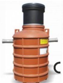
NG 2 / NG 4