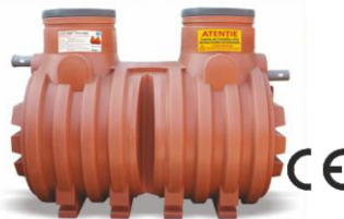
NG 10 / NG 15