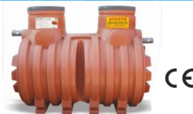
NS 6 / NS 10